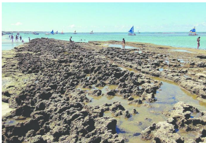
Recifes de arenito formando piscinas naturais durante a maré baixa (praia de Porto de Galinhas, Ipojuca, PE).

As rochas observadas na superfície terrestre em Pernambuco são englobadas em três categorias, segundo a gênese: ígneas ou magmáticas, sedimentares e metamórficas. Essas rochas, em muitos casos, possuem expressivo valor econômico. Assinala a alternativa que apresenta duas rochas sedimentares.